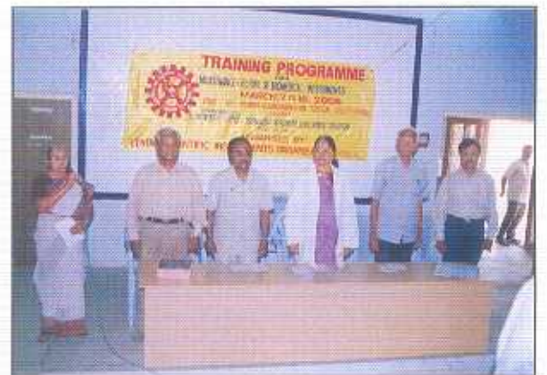
Inaugural function of training programme on 'Maintenance and Repair of Biomedical Instruments' (CSIO)