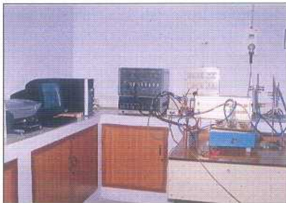
Evaluation of fuel cell electrodes using electrochemical work station (CECRI)