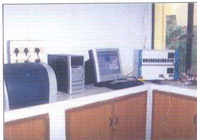
A prototype fuel cell assembled at this unit is being evaluated using Multistat Potentiostat / Galvanostat with frequency response analyzer (Solatron).