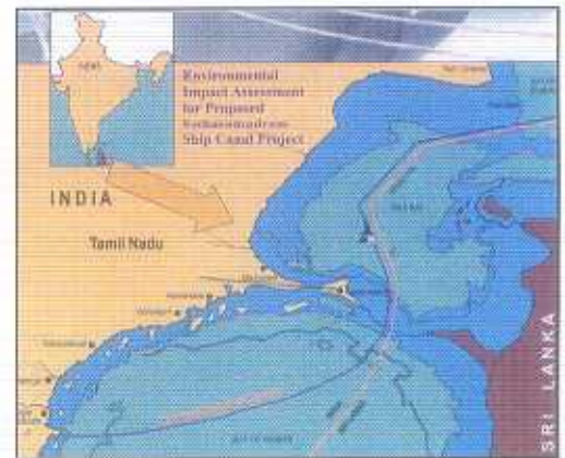
The Proposed Alignment of the Sethusamudram Ship Canal (NEERI)